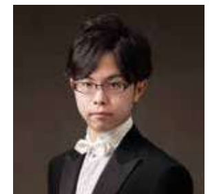
Sakakibara Atsuyuki GIAPPONE