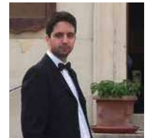
Rossetti Tiziano ITALIA