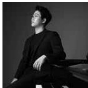
Park Nohun COREA