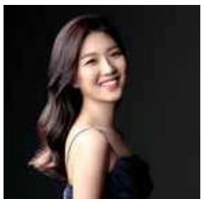
Park Nahye COREA