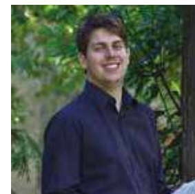
Rugani Simone ITALIA