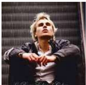
Buche Leon GERMANIA